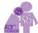
DE FRENTE AL ALZHEIMER, INC.